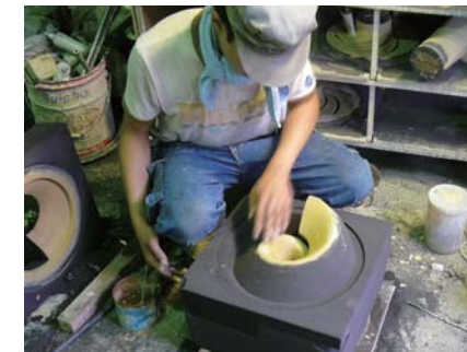
砂型の表面をなめらかにしているところ

「適正な利益の確保に向け、すべてを正直に公表します。『常に正直に、クリーンに』が私の信条です。品質管理についても同じことが言えます。特殊鋼鋳鋼品は、