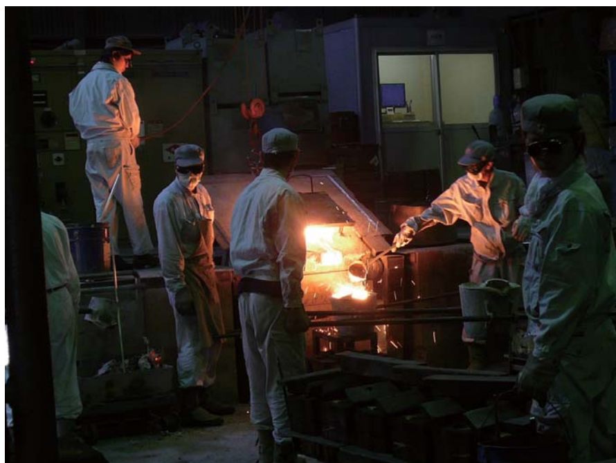
溶解した特殊鋼を炉から出すところ。溶解金属の温度は1600℃以上