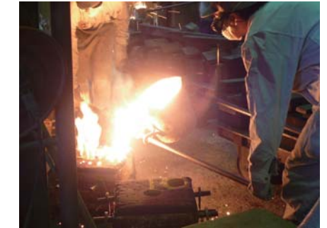
砂型に溶解した特殊鋼を流し込むところ

完成品を見ただけではプロでさえ中身の品質は分かりません。だからこそ、常に正直な心が大切なんです。すべて正直だから相手に信頼してもらえるのです」