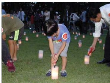
会員及びサポーターにより、点火が行われている様子。

ちなみに、ろうそくの製作・リサイクルを障害者自立支援の活用、竹の間伐材の使用を通じた竹藪の維持・高齢者雇用など、イベントによる地域の福祉・環境・経済への貢献も大きい。