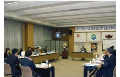
2市1町の実務者が具体的な連携方策について議論する「観光交流実行委員会」。

協議の場として、幹事会のほかに、実務レベルで具体的な事業の検討を行なう「観光交流実行委員会」を組織。実務に取り組む民間事業者を中心に構成され、2市1町での広域観光パンフレットの制作、観光コースの設定や、グリーンツーリズムの推進など、柔軟な発想を取り入れたアクション・プランづくりに取り組んでいる。