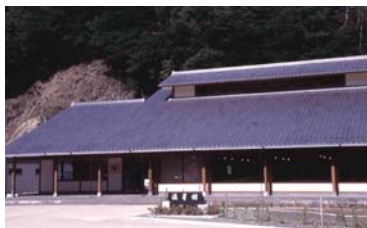
美しい星空は貴重な地域資源。町営ホテルの名も「流星館」。

年間48万人が訪れる道の駅をはじめとして、「名田庄あきない館」や「そば処よって亭」など、地域独自の特産品の魅力を最大限に活かしながら、集客・交流事業との両輪で、地域活性化をはかることを目指している。