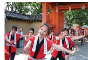
酒ぐらルネサンスで行われる「新酒番船パレード」では、にぎやかな音楽とともに、大勢の踊り手が練り歩く。

また、震災後の西宮のまちの復興と新たな魅力を再発見してもらうことを目的とした「にしのみや再発見バスツアー」は、砲台の内部や市内企業の社内見学など、普段見ることができない市内スポットをバスで巡るツアーであり、参加者からは「知らないところいっぱい行くことができ、とても楽しかった！」と好評を得ている。