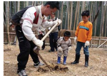
4月に行われた「やぶ開き」では、地域の農家の方がたけのこ掘りのデモンストレーションを行った。おもな参加者は、夫婦、女性グループ、家族連れなど。

竹林を保全・整備することは、農業、環境保全、景観形成や防犯（景観・見通しが良くなる）と、テーマに広がるところが面白いし、観光振興に活かせるポイントだと思います」