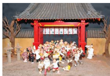
第7回のテーマは「園遊会に福来る」と題し、西宮神社での開門神事福男遊びの光景をデコレーション。人や鳥居、タイル全てがマジパンで製作されている。