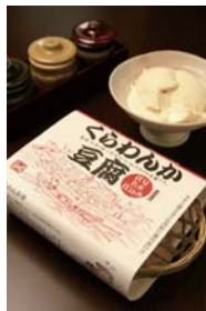
伏見ブランド品の第1号商品「くらわんか豆腐」。