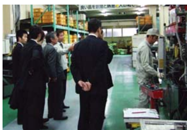
見学会当日の様子。参加者は毎回15～20人程度で、参加者と説明役とのフェイス・トゥ・フェイスの関係で進められる。

参加した教職員や若者からは、「モノ作りの奥深さを感じ、とても感動した」「他社に真似のできない製品の製造現場を見ることができて良かった」とたいへん好評で、リピーターも多いという。また、工業高校など未来のものづくり人材を育てる先生方と、教育現場との接点の少ない工場の従業員との出会い・交流の場としても期待されている。