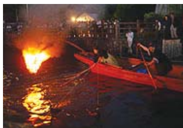
夏の夕べを彩る鵜飼

「くらわんか豆腐」という命名は、江戸時代に舟運基地として栄えた大阪・枚方市の「くらわんか舟」に由来している。その販売・プロモーションを進めていながら、伏見と「くらわんか」というイメージがつながり、広く浸透していけば、広域連携の具体的なシンボルとなって、さらなるブランド化が図られるものと期待されている。