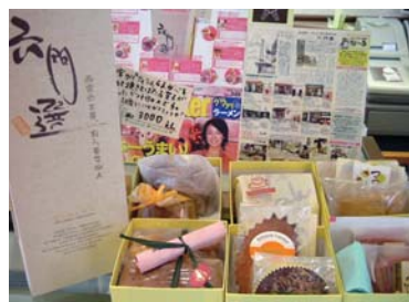
「六門選」は、各ケーキ店のお菓子が六段のお重に詰められたもの

さらに、周辺都市でも地域特性を生かしたイベントが開催されるようになり、宝塚市では市内農産品を使った創作ケーキ等がふるまわれる「おいしいまち宝塚」が、伊丹市ではベルギーの姉妹都市をヒントに、チョコレートテーマとした「伊丹ちょこリンピック」が、それぞれ開催されている。