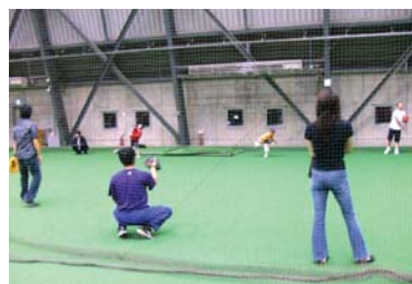
北海道日本ハムファイターズ室内練習場での親子キャッチボールの様子