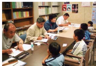
北海道警察本部での鑑識による子ども似顔絵作成の実演サービス