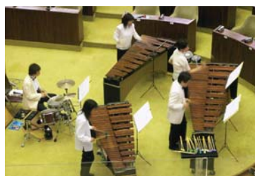
北海道議会議場では、施設開放に加えて、札幌交響楽団による無料コンサート「マリンバ・アンサンブル」を開催。

また、来場者だけでなく、プログラム提供者も、楽しみながら参加しているところも、魅力の1つといわれている。「参加施設の人からは、普段の仕事の説明している際に、子どもたちが喜び、驚く顔を間近に見て「働きがい」を感じた、というお話を聞いたこともあります」(同・佐々木さん)