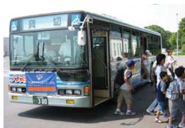
つくばサイエンスツアーバスを利用する子どもたち。

JAXA 独立行政法人宇宙航空研究開発機構・筑波宇宙センターで、人工衛星の試験モデルの説明を受ける。