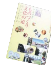
平成18年度に採択された「地域資源∞全国展開プロジェクト」（名古屋商工会議所）の一環として、いままでの取組みを「名古屋西区ものづくり文化の道ガイドブック」にまとめた。この冊子をボランティアガイド教科書にすることも検討している。