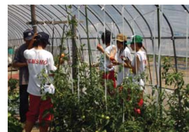
農業・農村体験の受入れ組織等の広域ネットワーク組織「そらちD.E.い〜ね」を通じて、全国各地から農業体験目的で空知地域を訪れている。