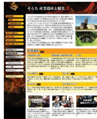
ホームページ「そらち 産業遺産と観光」のトップページ ( http://www.sorachi.pref.hokkaido.jp/so-tssak/html/ )

そういった地域の魅力をつなぎ、空知の観光をステップ・アップさせるのが本事業の目的です。そのためには、いろいろな地域や分野のキーパーソンが顔合わせする場の設定が必要。お互いの活動を知ってもらい、ネットワークが広がっていくことを期待しています」(北海道空知支庁商工労働観光課・横田紀子さん)