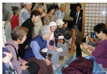
バスツアーは6000円より。日帰りという手軽さ、学んで体験できるというお得感などが、好評の理由。