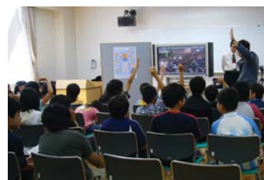
第4回目のカルチャーナイトでは、札幌市立資生館小学校と西興部村小学校が、インターネットで交信した。

また、第4回目からは、カルチャーナイトは1日だけではなく、「前夜祭」と題して、文化フォーラムや音楽イベント、カルチャーナイトウェディング、他のカルチャーナイト開催地域とのインターネット交信など、新たな取組みに挑戦し、進化を遂げている。