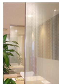
【パーテーションとして使用】

和の意匠性に優れながらも、主張しすぎない上質な空間が演出でき、内装、外装使用の需要にも対応可能。挟み込む生地 of 透明感の調整、案件要望ごとの紋様表現や柄のカスタマイズが可能であり、他の競合する商品と比べて競争力がある。