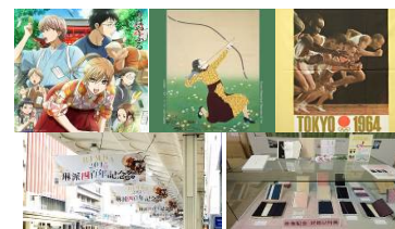
【オリジナルデザインが可能】