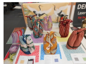
【ふろしきの展示例】