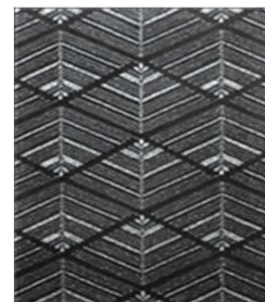
【薄地絹織物に刺繍加工】

日本の魅力を表現するために特有の素材や、和風モダンな建材等を導入しているホテル・旅館などの宿泊施設や商業空間、マンション・公共施設の共用部等を主な導入先と想定している。“絹ガラス”は、日本の文化性をモダナイズし、和の洗練を極めた意匠性を有していることから、大きなポテンシャルがあると見込んでいる。