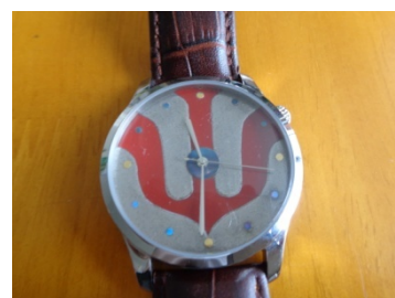
【ウルトラマン蒔絵腕時計】