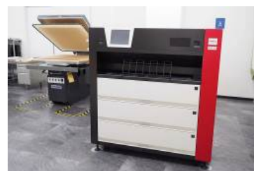
【デジタル転写捺染設備】