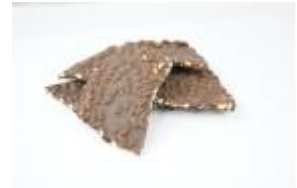
福井米 割りチョコレート