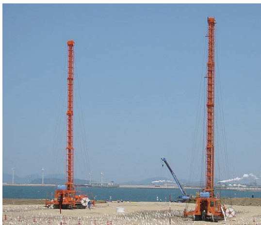
キャスルボードドレーン工法