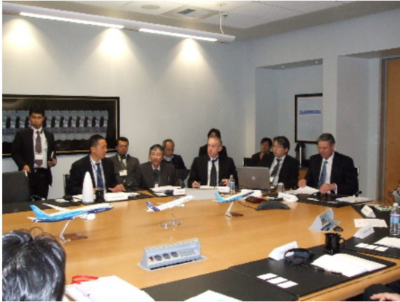
( 周辺サプライヤーとの意見交換 )