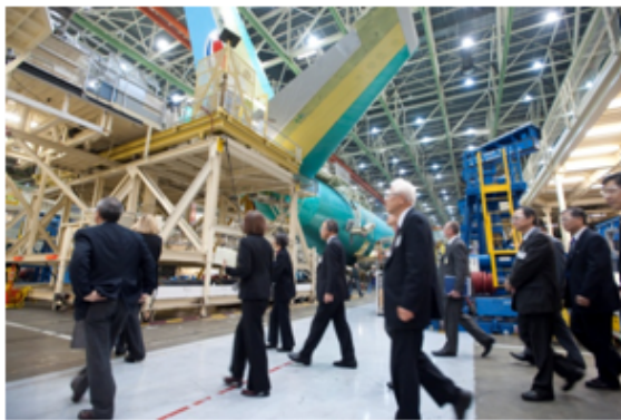
( ボーイング社エバレット工場視察 )