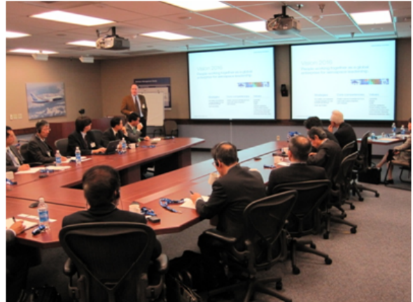
( ボーイング社との意見交換 )