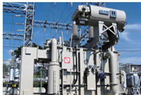
写真：受電用変圧器での導入事例