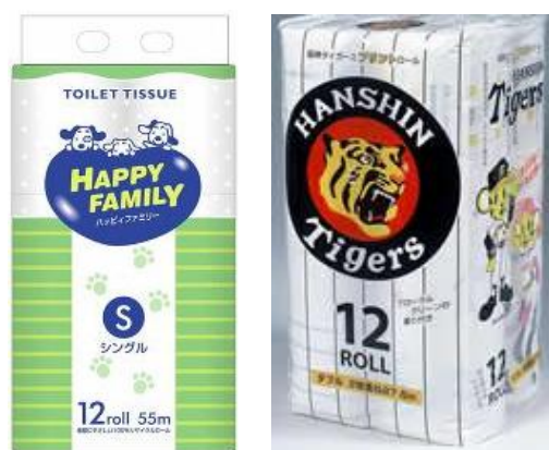
トイレトペーパー商品例

以前は、毎日複数回、重油タンクローリーが燃料供給に来ていましたが、ガス化により、その手間が削減されたこと、燃料管理が不要になったこと、安定的な燃料供給が可能になったというメリットが生じています。