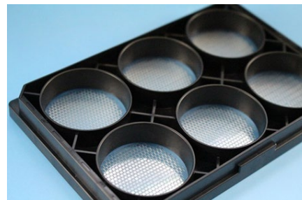
細胞培養プレート