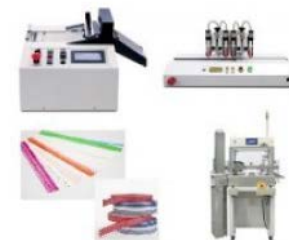
イムノクロマト関連機器