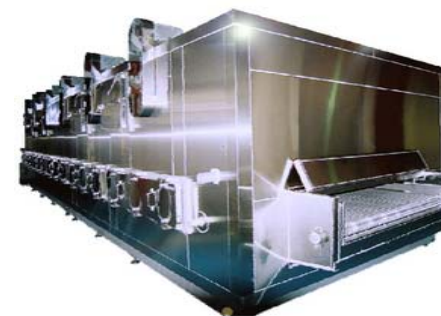
連続式プロトン凍結機