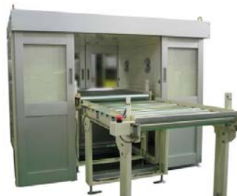
物品用エアシャワー