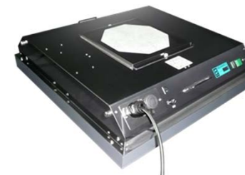
ファンフィルタユニット