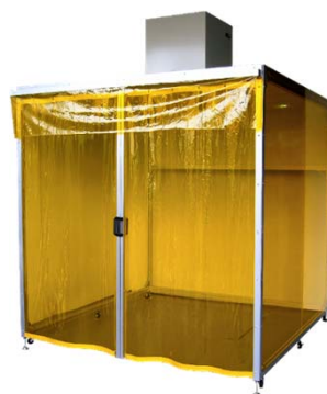
防爆型クリーンブース