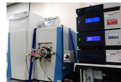
nanoLC-Q Orbitrap型質量分析計 3000RSLCnano-Q Exactive