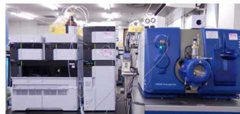
液体クロマトグラフ-四重極型質量分析計 Nexera-Triple Quad6500