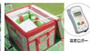
定温輸送ボックス