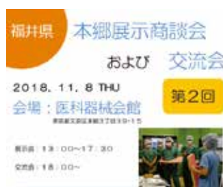
県主催展示商談会