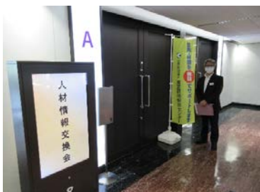
2020年の人材情報交換会

※新型コロナウイルス感染症対策のため、1社あたりの面談時間を10分とさせていただきます。 当日時間不足となった場合は、後日別機会を設けていただくように調整を図ります。