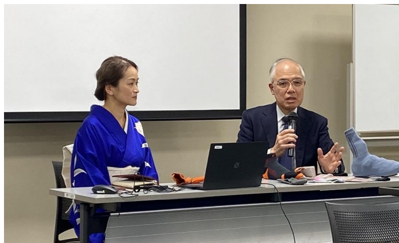
ディスカッション&質疑応答