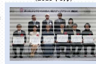
第3回アワード表彰式 (2019年3月)

2018年度には第3回アワードを実施し、2019年3月に関西インバウンド大賞と特別賞(5部門)の計6事業を表彰しました。