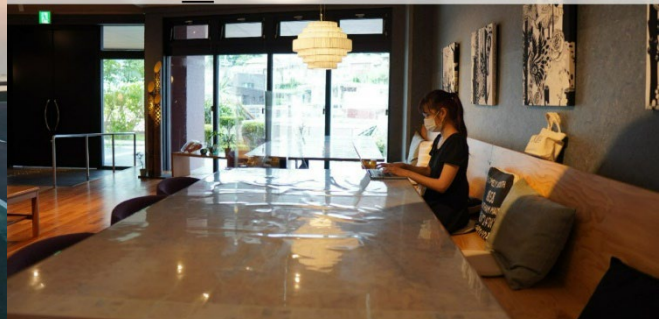
ワーケーション ウィークリープラン

*日常を離れ、南紀白浜で仕事と遊びの両立。施設内にはコワーキングスペースも完備しているので、ON/OFFの切り替えも「仕事に疲れたら一泊や温泉でリフレッシュ」ワーケーションの都合に合わせて様々なワーケーションや楽しみ方での滞在が楽しめる。詳しくは「ご利用」をご覧ください。