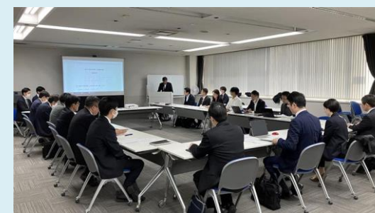
堺DX推進ラボ第1回連絡会議の様子