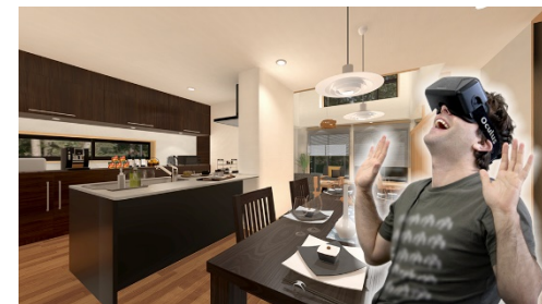
CADデータから簡単にVRに展開

注文住宅の完成イメージのプレゼンテーションにおいて、従来ではパースや模型を活用していたが、顧客が空間イメージを掴むのに時間を要していた。しかし、VRの活用によって顧客が空間をイメージしやすくなり、商談時間が大幅に短縮された。このようにVRはハウスメーカーの営業担当者の業務効率向上にも貢献している。