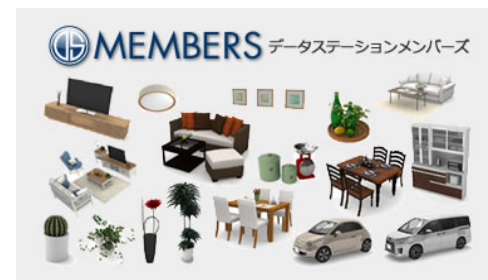
DATA STATIONから3D素材をダウンロード