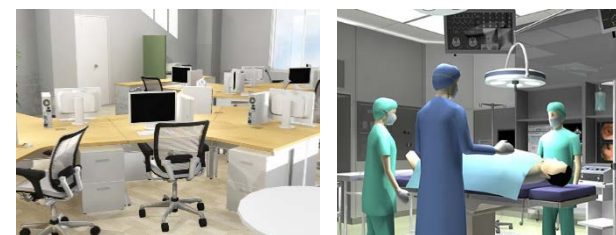
同社のオフィス・医療施設・工事現場など各種空間作成用ソフトで作成した3Dデータをインポートして、VRプレゼンが可能