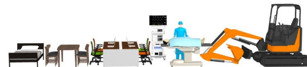
実在メーカー製品を含む5万点以上の3D素材を提供