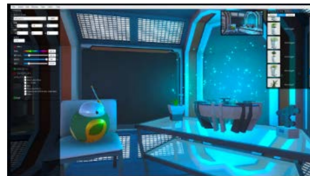
CG素材を配置するだけで簡単にVRコンテンツを制作