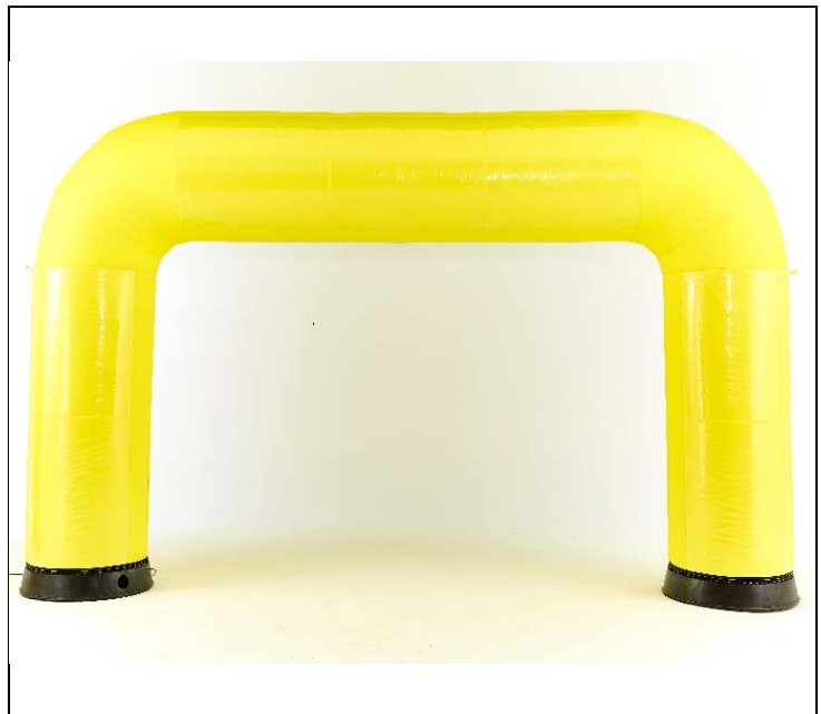
エアーアーチ(全体)