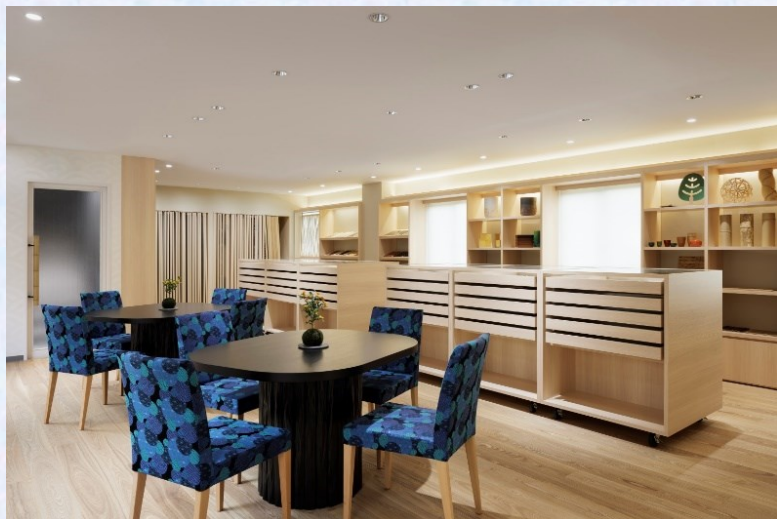
〈2F マテリアルライブラリー〉