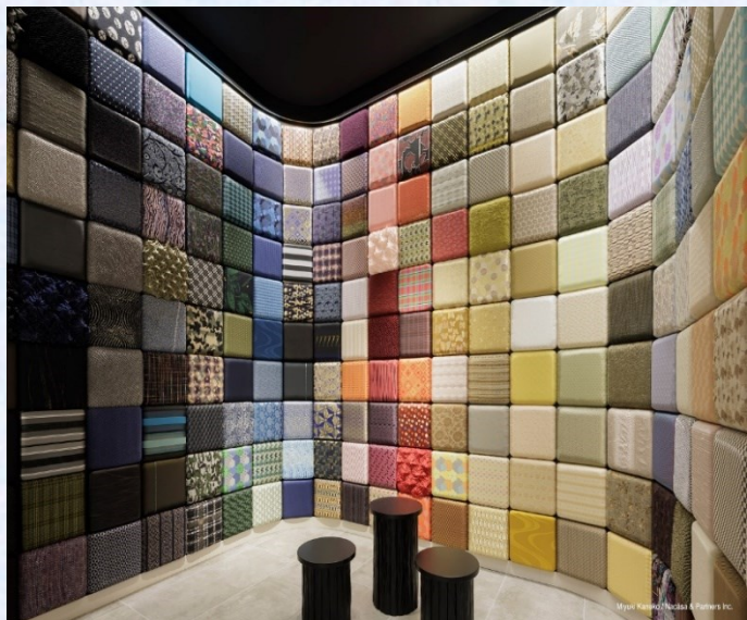
〈織物生地のサンプル〉