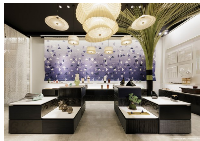
〈ショールーム1F ギャラリー〉

商社として、ホテルや店舗、建築・デザイン事務所等との商談を行うことから、企業ごとの商品の紹介ではなく、「WAZAI」と銘打って、竹、陶、漆、和紙、織・染などのカテゴリーを設けたカタログを作成し、新しいインテリア素材・商品の提案を行っている。