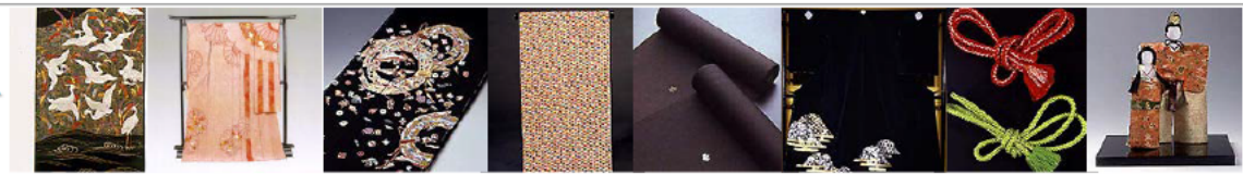
西陣織 京鹿の子紋 京友禅 京小紋 京黒紋付染 京繕 京くみひも 京人形