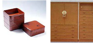
紀州漆器 紀州箆筭