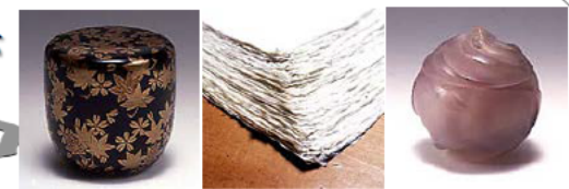
越前漆器 越前和紙 若狭めのう細工