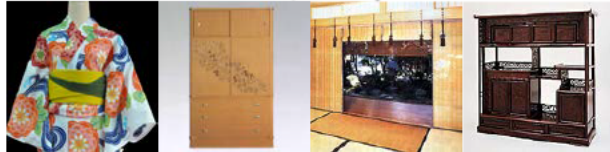
浪華本染め 大阪泉州桐箆筭 大阪金剛簾 大阪唐木指物