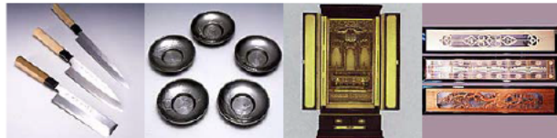
堺打刃物 大阪浪華錫器 大阪仏壇 大阪欄間