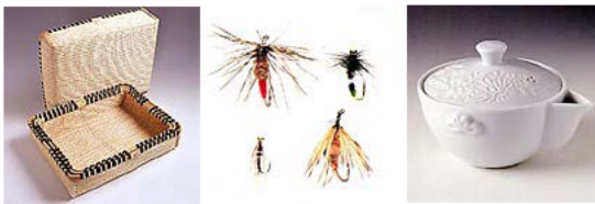
豊岡杞柳細工 播州毛鉤 出石焼