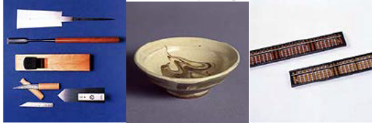
播州三木打刃物 丹波立杭焼 播州そろばん