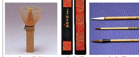
高山茶釜 奈良墨 奈良箆