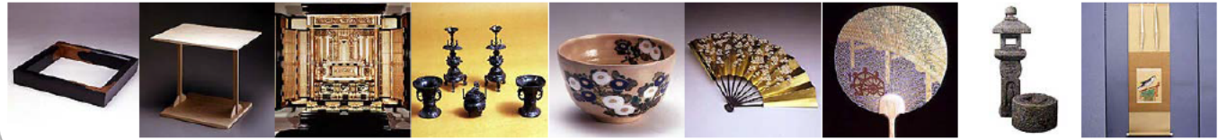
京漆器 京指物 京仏壇 京仏具 京焼・清水焼 京扇子 京うちわ 京石工芸品 京表具