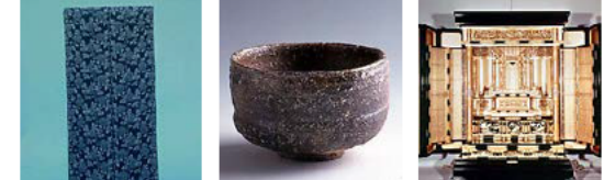
近江上布 信楽焼 彦根仏壇