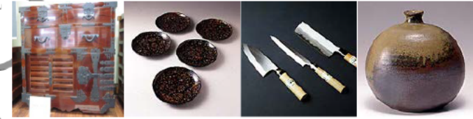
越前箆筭 若狭塗 越前打刃物 越前焼