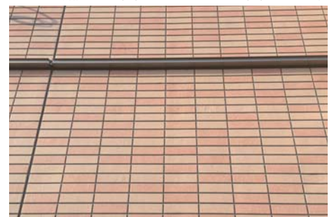
2色のモザイクタイル調を実現したKEPT施工物件