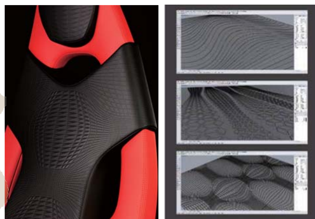
世界初！凹凸をデザインできる

従来の離型紙工法でも離型紙再利用は実施していましたが、繰り返し使用することで離型紙自体の劣化が発生し柄の再現性が損なわれることで利用率の上限がありました。本製品は、フラットで柄のない離型紙を使用する工法であり、柄の再現性での離型紙劣化の懸念が無くなり、廃棄ロスを大幅に削減できます。具体的には、実績ベースでおよそ10ton/月であった離型紙廃棄量を1ton/月と、10分の1まで削減可能です。また、柄をDATA化できることで、新デザイン考案の際の柄の自由度が向上し、実物がなくても精度の高い新柄の評価をグローバル且つ短時間で共有できます。