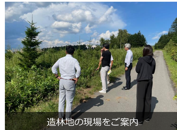
造林地の現場をご案内