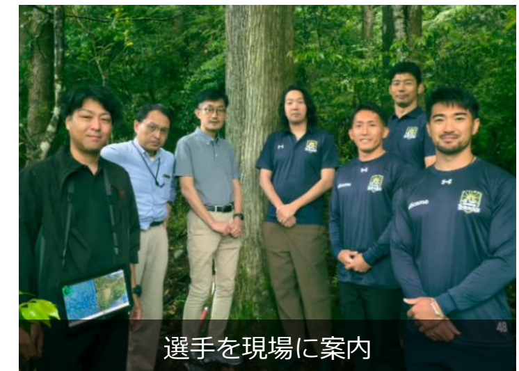
選手を現場に案内