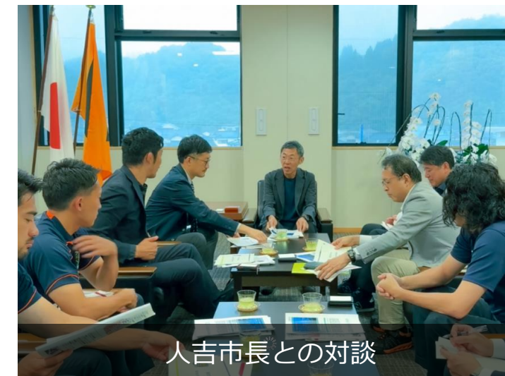
人吉市長との対談