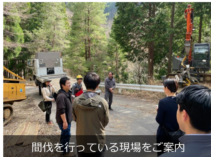
間伐を行っている現場をご案内