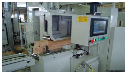
プレカット加工の様子