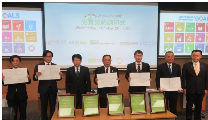
島根県知事出席のもと J-クレジットの調印式を開催しました

弊社のJ-クレジットをご購入いただくことで、島根県出雲市の森林保全に貢献いただけます。 また、弊社の活動として「J-クレジット購入時の調印式」「出雲の森での植林活動への参加」などを行っています。