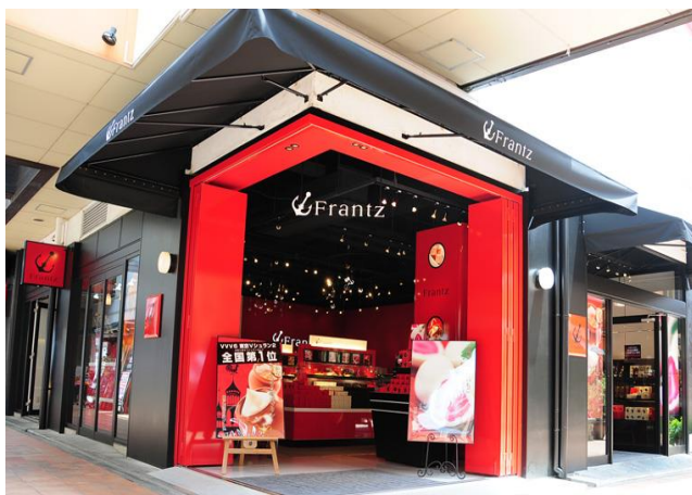
神戸の洋菓子店様にもご購入いただきました 商品の購入を通して森林保全に貢献していただいています