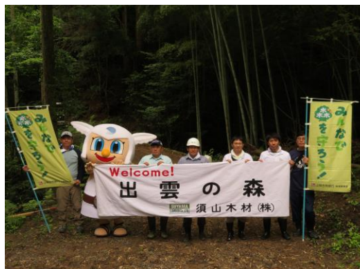
ご購入企業社員様による 植林活動・記念植樹を行いました