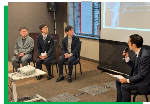
【第2部】パネルディスカッション