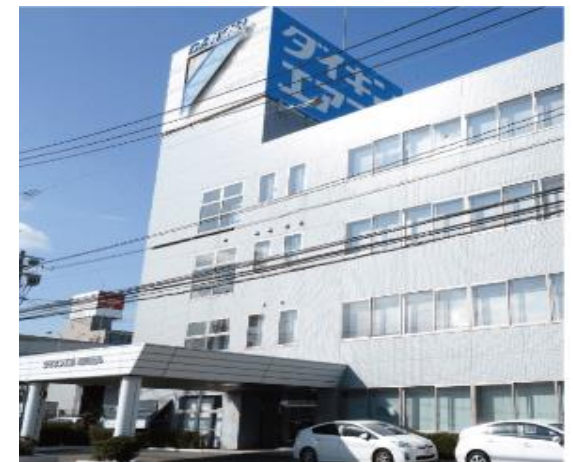
ZEB Readyを達成したダイキン工業福岡ビル

改修を機に、 ①潜熱顕熱分離空調システム ②空調・換気+照明一括制御 ③遠隔監視システムによる最適容量選定 により、ZEB Readyを達成。