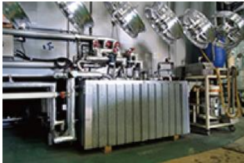
ガスボイラーとヒートポンプのハイブリッド運用でCO 2 排出量を削減