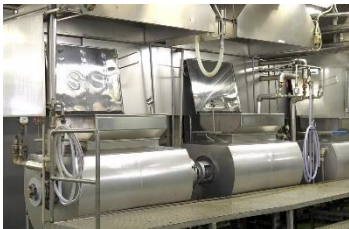
あんを製造する工程で蒸気ボイラーの熱を利用している

→ EMS導入前と比較して、 60.6kL（削減率：4.1%）のエネルギー削減効果があった