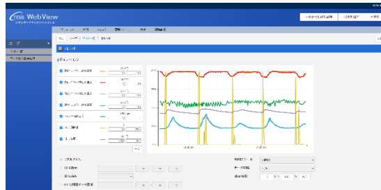
エネルギー使用状況はEMSと連携した端末でいつでも確認が可能

→ 設備更新前と比較して、 203.2kL（削減率：13.7%）のエネルギー削減効果があった