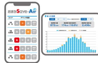
WEB画面で 簡単操作 & 見える化