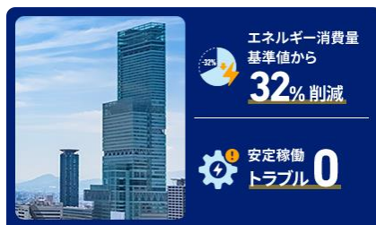
近鉄不動産株式会社 あべのハルカスでの事例

「 遠隔監視システム 」により 24時間設備を監視 し、万一のトラブルに対しても、迅速・的確に対応。