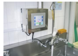
給水制御機器の設置例