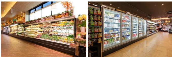
CO2冷媒冷凍冷蔵庫の導入事例

ノンフロンで地球環境保護にも優れた CO2冷媒 を用いた 冷凍冷蔵庫 についても 商品開発 し、従来の冷凍冷蔵庫に比べ10～15%の消費電力削減を実現。